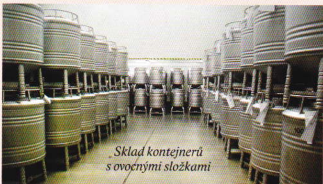
Sklad kontejnerů s ovocnými složkami

V České republice je výroba ovocných složek důležitou součástí potravinářského průmyslu, vyrábějí se zde ovocné složky na špičkové světové úrovni, které jsou dodávány tradičním výrobcům jogurtů a ostatních čerstvých mléčných výrobků. Část výroby se vyváží do zahraničí a naopak část spotřeby ovocných složek se dováží.